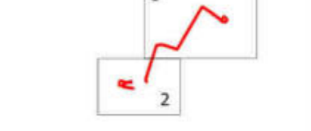
Схема размещения фидерных: